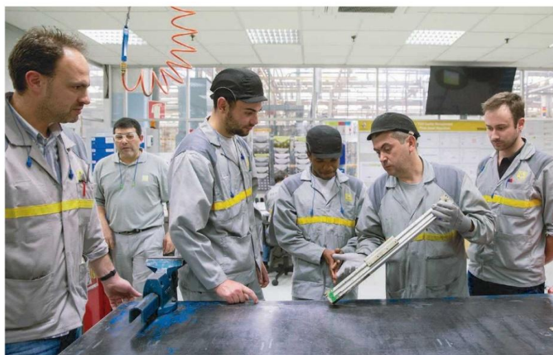
Seis alunos do curso de Manutenção Industrial e dois de Eletrónica e Telecomunicações da Escola Profissional de Aveiro aprendem na fábrica do grupo Renault em Cacia. Foram pedidos pela empresa e no final dos cursos devem ficar empregados